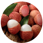
Lycium Barbarum (fruit du goji)