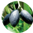
Extrait de fruit de chébulique noir