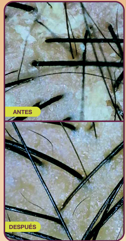
Unretouched photos; individual results will vary. Results after one use of AHA+ACV Pre-Shampoo Scalp Clarifying Rinse.