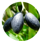
Schwarzer Chebulic Fruchtextrakt