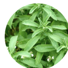
Steviolglyko- side aus Stevia