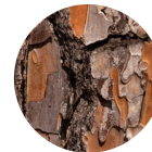
Extrakt aus der Rinde der Strandkiefer