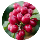
Coffea Arabica (Koffein)

Süßungsmittel: Xylit, Aroma, Säureregulator: Zitronensäure, Fruchtextrakt aus Schwarzer Chebula (Terminalia chebula), Säureregulator: Apfelsäure, färbendes Lebensmittel: Kurkuma (Curcuma longa) Rhizompulver, Isomalto-Oligosaccharid, Mangofruchtextrakt (Mangifera indica), Süßungsmittel: Steviolglycoside aus Stevia, Koffein (aus Coffea arabica Bohnenextrakt), Trennmittel: Siliciumdioxid, Distelöl (Carthamus tinctorius), Weihrauch (Boswellia serrata) Harzextrakt, Goji-Fruchtextrakt (Lycium barbarum), Farbstoff: Rote Bete.