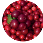
Preiselbeere Saft pulver