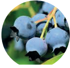
Kanadischer Heidelbeer Fruchtsaft