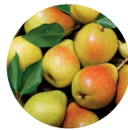
Birne Saft konzentrat