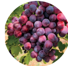
Rottrauben Saft Konzentrat