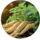
Panax Extrakt pulver