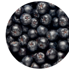
Aronia Saft konzentrat