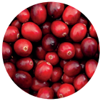
Cranberry Konzentrat pulver