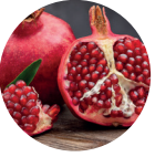
Granatapfel Saft konzentrat