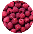
Himbeere Saft konzentrat