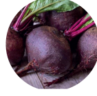
Kırmızı Pancar Suyu