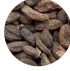
Kara Halile Ekstresi