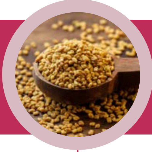
Çemen Tohumu Ekstresi