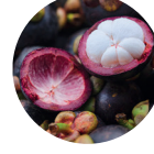
Mangostana Suyu Tozu