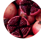
Nar Suyu Tozu