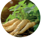
Kırmızı Kore Ginsengi Ekstresi