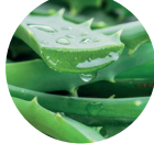
Aloe Vera Jel