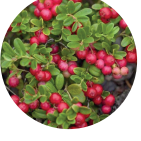
Turna Yemişi Konsantresi Tozu