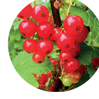
Korimboz Vaksiniyum Tozu