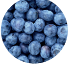
Yaban Mersini Ekstresi