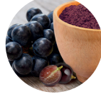
Üzüm Çekirdeği Ekstresi