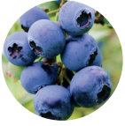
Yaban Mersini Konstantresi