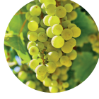
Üzüm Suyu Konsantresi