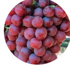
Kırmızı Muskadin Üzümü Ekstresi