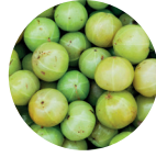
Üzüm Kabuğu Ekstresi