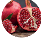
Nar Suyu Konsantresi

Su, Fruktoz, Üzüm Suyu Konsantresi, Armut Suyu Konsantresi, Yaban Mersini Konsantresi, Kırmızı Muskadin Üzümü Ekstresi, Ahududu Konsantresi, Aroniya Konsantresi, Asitlik Düzenleyici (Sitrik Asit, Malik Asit), Korimboz Vaksiniyum Tozu, Misket Limonu Suyu, Taurin, Nar Suyu Konsantresi, Siyah Havuç, Üzüm Kabuğu Ekstresi, Mangostana Suyu Tozu, Doğal Aroma Verici (Ahududu, Üzüm suyu), Kıvam Arttırıcı (Ksantan Gam), L-Askorbik Asit (C Vitamini), İnositol, Nikotinamid (Vitamin B3), Deniz Tuzu, Kalsiyum D-pantotenat (Vitamin B5), Üzüm Çekirdeği Ekstresi, Aloe Vera, Tatlandırıcı (Steviol Glikozit), Ispanak, Haskap (Antosiyininler), Yaban Mersini Ekstresi, Nar Suyu tozu, Brokoli tozu, Kıvırcık Lahana, Kırmızı Kore Ginsengi Ekstresi, Piridoksin Hidroklorür (Vitamin B6), Tiamin Hidroklorür (Vitamin B1), Turna Yemişi Konsantresi Tozu, Riboflavin (Vitamin B2), Açai Suyu Tozu, Embilika Ekstresi, Siyanokobalamin (Vitamin B12), Pteroilmonoglutamik Asit (Folik Asit), D-Biotin (Biotin).