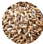
Semena ostropestřce mariánského