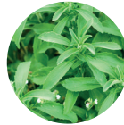
Steviolglykoside aus Stevia