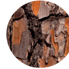
Extrakt aus der Rinde der Strandkiefer