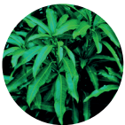
Extracto de fruta de Mango