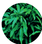
Extracto de fruta de Mango