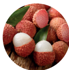
Lycium Barbarum (Fruta de Goji)