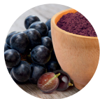
Extrait de peau de raisin