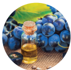
Extrait de pépins de raisin