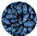
Baie de chèvrefeuille bleu