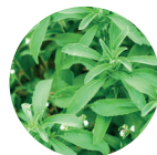
Extrait de feuille de stévia