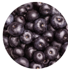
Bacca di Acai