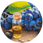
Estratto di Semi d'Uva