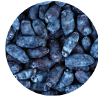
Bacca di Haskap