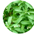
Estratto di Foglie di Stevia