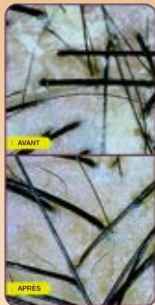
Photos non retouchées, les résultats viennent d'une personne à l'huile. Résultats après une utilisation du AHA + ACV Rinçage purifiant pour cuir chevelu pré-shampooing.